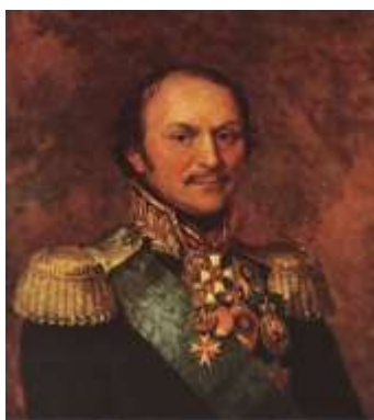
Платов Матвей Иванович