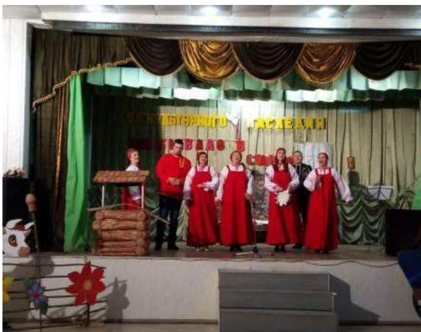
Муниципальное казенное учреждение культуры «Культурно-досуговый центр села Покровского Красногвардейского муниципального округа Ставропольского края»