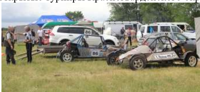
В селе Ладовская Балка турнир по автокроссу

Ежегодно, в преддверии празднования Великой победы на территории района проводятся открытые турниры Красногвардейского округа.