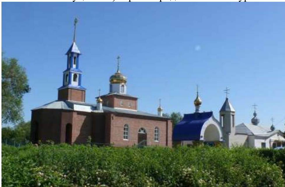
Свято-Николаевская церковь (с. Дмитриевское)

церковь (с. Дмитриевское), Свято – Троицкий храм и храм Успенья Божьей Матери (с. Красногвардейское), один из которых - Свято – Троицкого – является уникальным памятником архитектуры. В нем сохранился фарфоровый иконостас Кузнецкого завода в Екатеринбурге (из 24 изготовленных уцелел 1). Время продолжения экскурсии 3 часа.