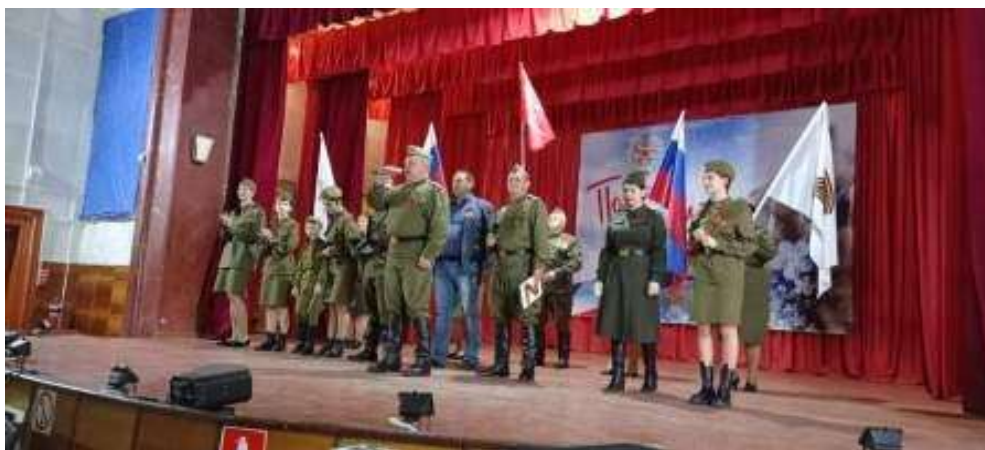
Муниципальное казенное учреждение культуры «Культурно-досуговый центр села Преградного Красногвардейского муниципального округа Ставропольского края».